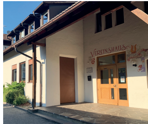
Beim Vereinshaus in Lengstein sollen eine energetische Sanierung sowie interne Umbauarbeiten durchgeführt werden.

Die Zufahrt zum Nördererhof und der Güterweg im Bereich Nörderer Au in Gissmann sind bei den Unwettern im letzten Sommer stark beschädigt worden. Auf der Zufahrtsstraße zum Nördererhof ist es deshalb dringend notwendig, die Mauer im Bereich des Durchlasses zu sanie-