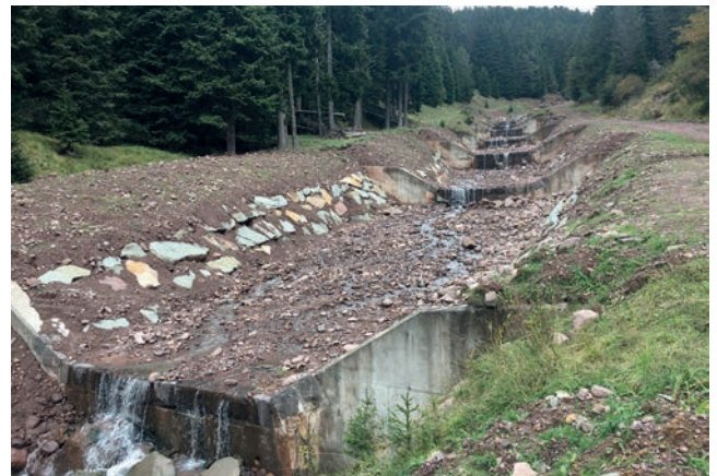
Gesäubertes Bach mit wieder hergestellten Ufermauern aus Zyklosteinen