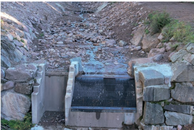
Erneuerte Bachfassung im Osterbach