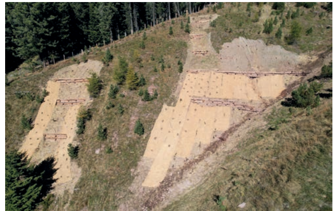
Durchgeführte Hangverbauungen in der Hauserlahn