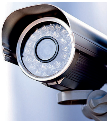
Die zehn Videoüberwachungskameras werden demnächst an das Glasfasernetz angeschlossen.

In den verschiedenen Rittner Fraktionen sind insgesamt zehn Videoüberwachungskameras vorgesehen. Diese sind bereits installiert und müssen nun an das Glasfasernetz angeschlossen werden. Der Ausschuss beschloss, diesen Auftrag an die Firma Tirolcom GmbH zu übertragen (12.796,66 Euro zuzüglich Mehrwertsteuer). Außerdem wurde die Firma Ithel GmbH mit der Installation der nötigen Software, Umstellung bzw. Anschluss der Videokameras an das Glasfasernetz, Installation des Videoüberwachungssystems bei der Tiefgarage Kaiserau und Anschluss der Videokamera bei der E-Bike-Station bei der Bergstation in Oberbozen beauftragt (25.840,00 Euro zuzüglich Mehrwertsteuer).