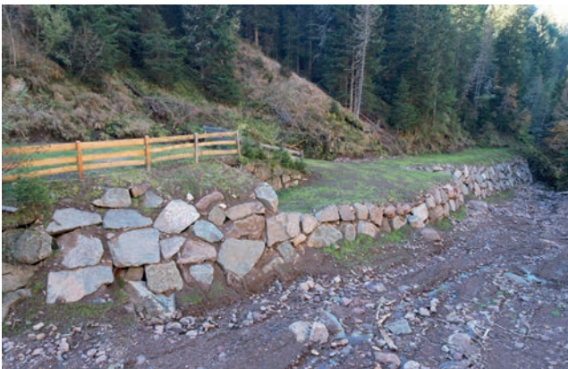
Wieder hergestelltes Bachufer, welches durch die Unwetter abgerissen wurde